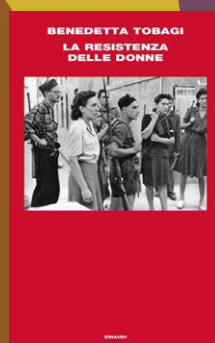
Benedetta Tobagi La Resistenza delle donne EINAUDI